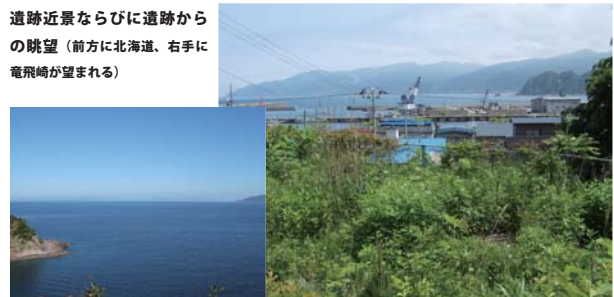
遺跡近景ならびに遺跡からの眺望(前方に北海道、右手に電飛崎が望まれる)