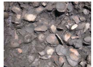
弥生土器出土状況