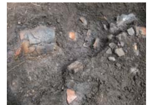
縄文土器出土状況