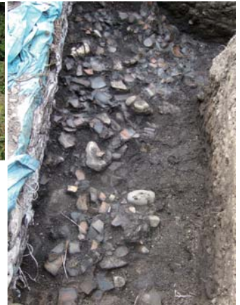
弥生土器出土状況