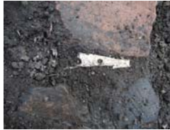
閉窩式離頭銚出土状況