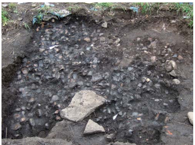
弥生土器出土状況