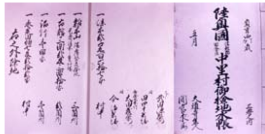
中里村御検地水帳(弘前市立図書館蔵)

寛政10年(1789)中里を訪れた菅江真澄は、城跡出土の「金飯」を見たことを書き残していますが(「邇辞貴迺波末」)、「封内事実秘苑」においても「法花寺近所之山」から「板金」が見つかり、ここが「舊き城跡」である旨が記されています。なお「津軽大成記」では、「国中城跡考」の項で「中里ノ館」の名をあげ、館主不明の館跡に分類しています。